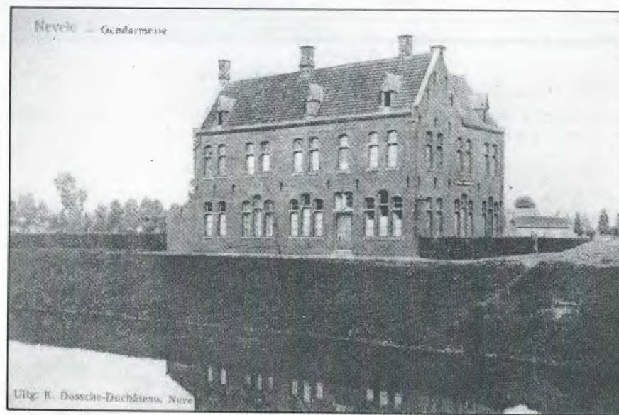
De Rijkswachtkazerne in 1909